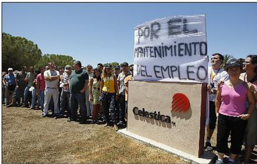
Protesta de los trabajadores contra los despidos

La empresa plantea el despido de la mitad de la plantilla “para poder mantener la planta de La Pobla de Vallbona”