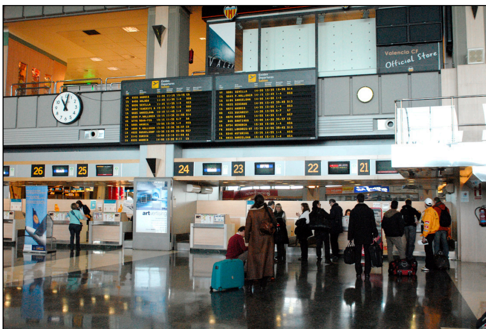
Terminal del aeropuerto de Manises