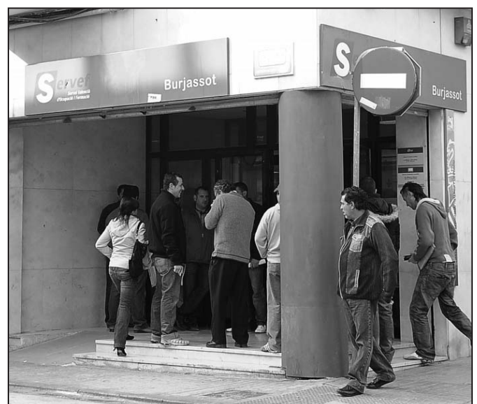
Cola en una sede del Servef

Así, un trabajador que es despedido de manera procedente sí tiene derecho a la prestación contributiva. Desde hace siete años.