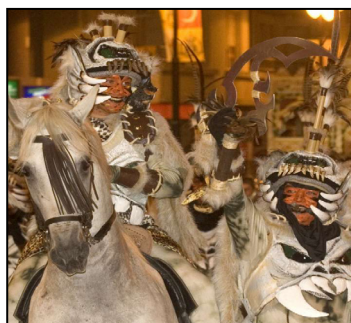
Fiestas locales de Ontinyent