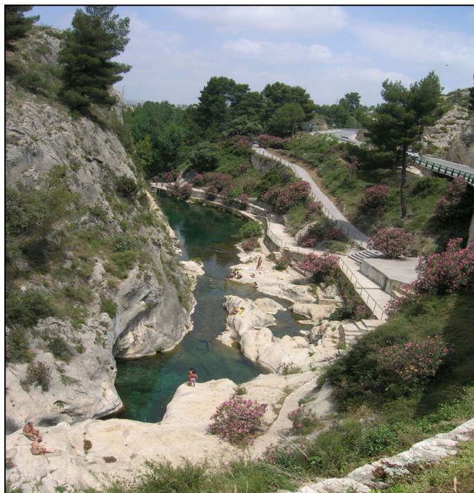
Los parajes naturales armonizan con las construcciones

En la actualidad, la economía de Ontinyent se basa en la industria textil. Entrando al pueblo por la calle Mayor vemos ya la fachada modernista de la fábrica La Paduana. Una industria que ha sido referente no sólo en España sino internacionalmente: Gandía Blasco, Revert, Tejidos Reina y Colortex son algunos ejemplos. Empresas que han sufrido las consecuencias de la crisis y muchas de ellas han tenido que cerrar, como La Paduana, mientras que otras se enfrenan a diversos EREs.