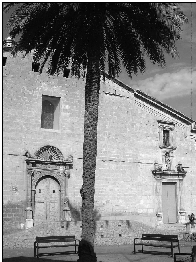
La arquitectura eclesiástica es de las más ricas de la Comunitat

La economía se basa en la agricultura (cereales), complementado por la ganadería (vacas) en la zona sur. Al norte e interior se desarrolla igualmente el cereal, pero como complemento destaca el auge de la oveja. Todo ello, con las excepciones como Olocau, donde encontramos una economía más pastoril (sin ausencia de cereales).