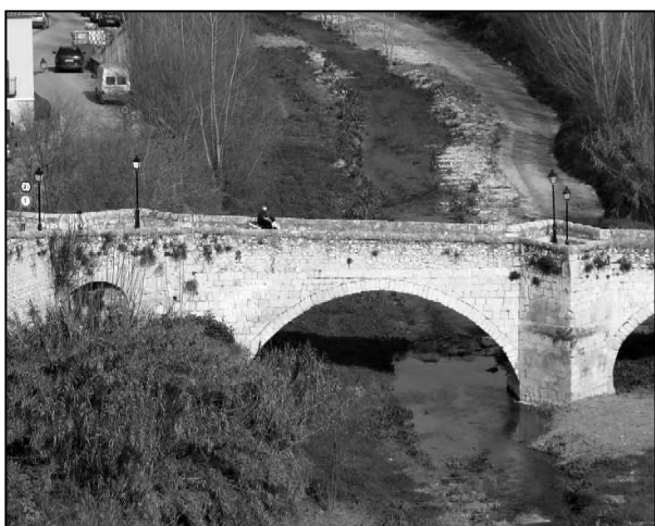
El Pont Vell sobre el Clariano

Población de Valencia situada a la orilla del río Clariano que limita con Agullent, Ayelo de Malferit, Bocairente, Fontanares, Vallada, Mogente (Valencia) y Bañeres y Alfara (Alicante) de relieve muy montañoso presidido por la Sierra Grossa.