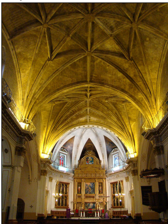
Interior de la Iglesia de Santa María

- Iglesia de Santa María (siglo XIII) dedicada a la Asunción de Nuestra Señora, de diversos estilos: románico, gótico y renacentista. A esta iglesia Jaime I acudió a oír misa tras reconquistar la población. A la derecha, la capilla de la Purísima con puerta independiente que recae sobre la fachada principal. El campanario es el más alto de la Comunidad, con 72 metros de altura, y el segundo más alto de España.