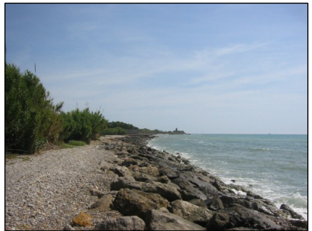
Costa del término municipal