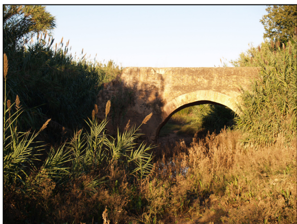
Acueducto dels Arquets