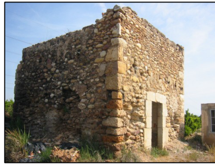
Torre de Sant Jordi

Desde su fundación hasta la primera mitad del siglo XX, el municipio basó todo su potencial económico en una agricultura mixta de secano extensivo y de huerta intensiva. El naranjo transformó, directa e indirectamente, los pilares de la idiosincrasia de la ciudad. En función de su interés, entre 1880-1960 se convirtieron 3.500 Ha. de secano a regadío, se desarrolló una incipiente y apreciable industria de transformación de críticos. Sin embargo, la política de fomento de la vivienda y del turismo que caracterizan los años 60 del pasado siglo determinó que se optara por invertir en una industria tradicional de la comarca: la azulejera. De ahí, que la industria del azulejo y revestimiento cerámico sea el principal motor económico de la ciudad en la actualidad.