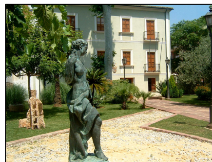
Jardín de Polo

No puede obviarse tampoco el sector papelerero, representado en la empresa Clariana , de la Familia Simó y predecente de Ontinyent.