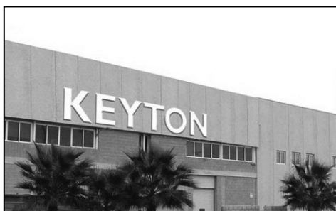
Una de las factorías de la multinacional