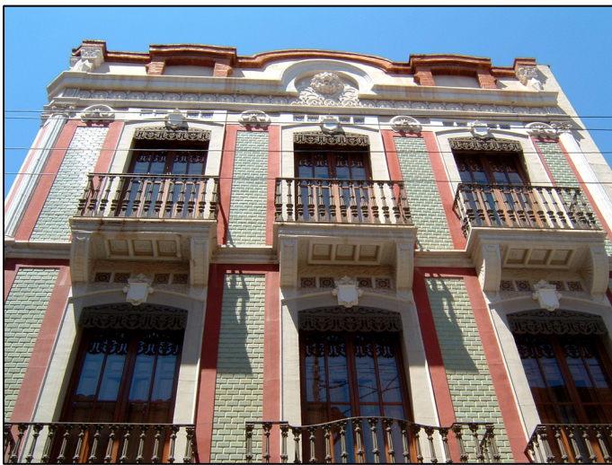
Casa dels Coret

Los pavimentos y revestimientos han ido conformando un ciclo productivo, cerrado e integrado en la ciudad, que la ha convertido en el centro azulejero más importante de España y en uno de los punteros de Europa. Hoy la vida económica de la ciudad, sin duda, aunque no de una manera exclusiva, se mueve a partir del motor de la cerámica que impulsa al resto de sectores productivos e institucionales.