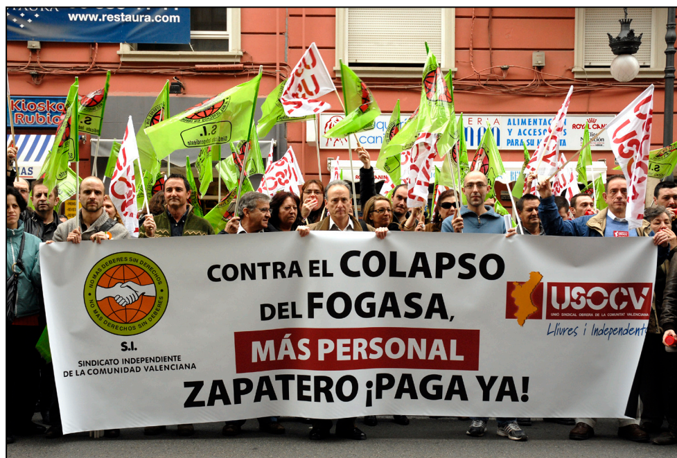
Representantes, afiliados y simpatizantes de SI y USO ante la sede del FOGASA