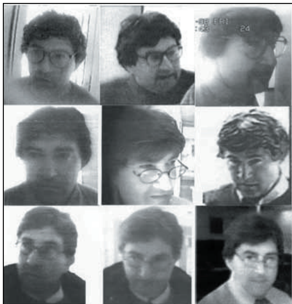
Identidad desconocida Buscado por robos en entidades bancarias de Levante

Incluimos una sección dedicada a la búsqueda de individuos con causas pendientes con la Justicia española. En este caso, publicamos las fotos de tres individuos, perseguidos por distintos delitos.