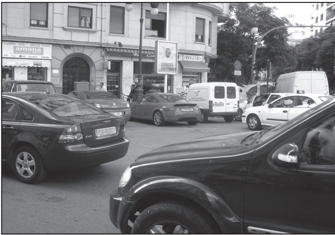
El cruce entre Ángel Guimerá y Guillén de Castro

La Policía no multa y la grúa no retira los vehículos. Todos los que vivimos en el barrio sabemos que si queremos, tenemos ocho o nueve sitios para aparcar, que no son zona azul y que “no molestan a nadie”.