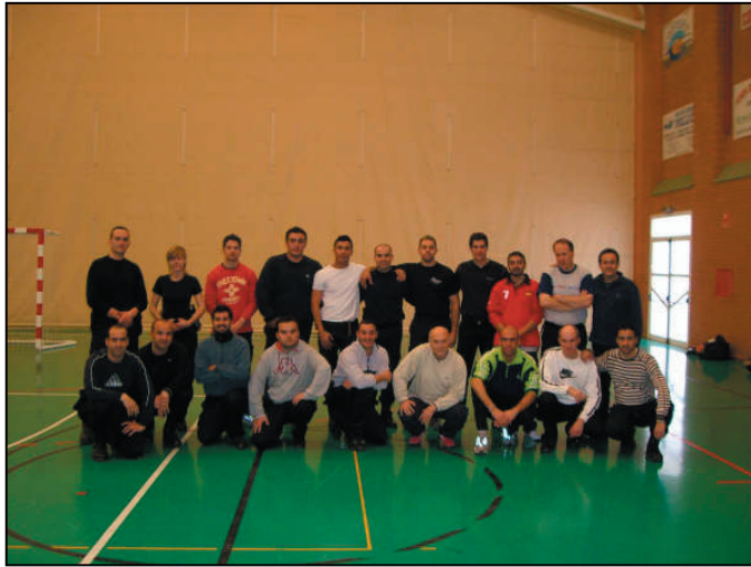
Los asistentes al curso