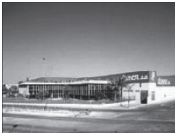
La sede de Dusen SA en Castellón

El Comité anterior lo integraban 3 miembros de CCOO, 3 de UGT y 3 de S.I., al superar la empresa los cien empleados.