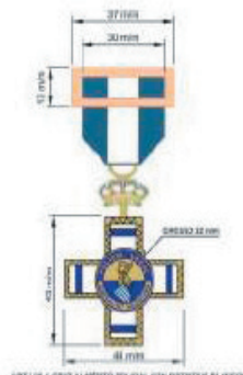
CRUZ AL MERITO POLICIAL CON DISTINTIVO BLANCO