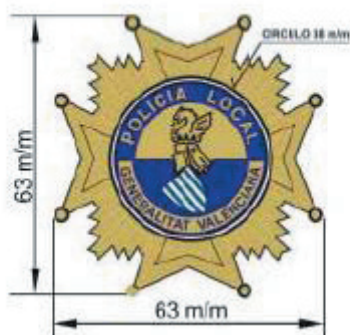
MEDALLA DE ORO AL MÉRITO POLICIAL DE LA GENERALITAT