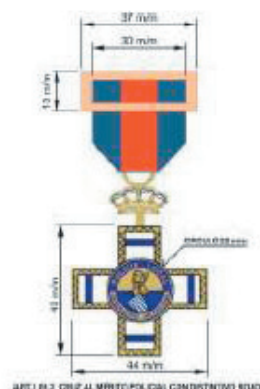
CRUZ AL MERITO POLICIAL CON DISTINTIVO ROJO