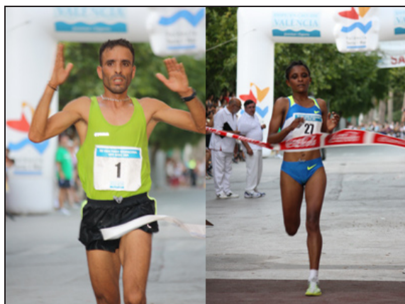
Los ganadores de 2009, XXX edición del GFI de Siete Aguas

El Sindicato Independiente mantiene su compromiso de apoyo y fomento de actividades deportivas populares, que además de impulsar la buena práctica del ejercicio físico, contribuyen a la creación de empleo, en este caso en municipios pequeños del interior de la Comunitat.