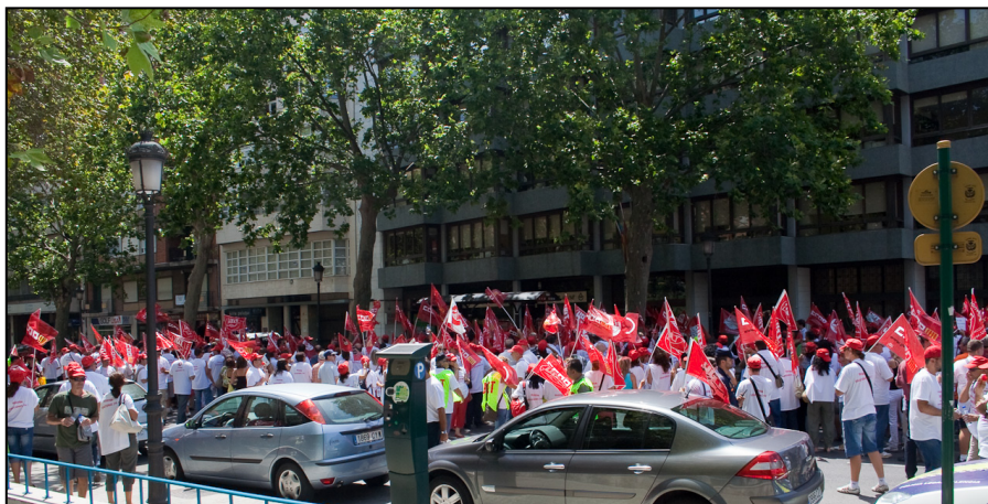
Una de las movilizaciones de los trabajadores. Los colores del SI no estuvieron presentes por decisión de UGT y CCOO