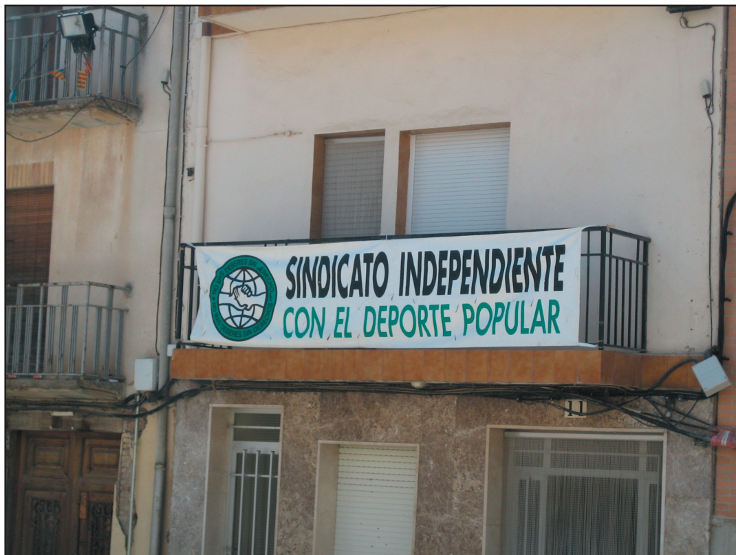
La pancarta que todos los veranos confirma la colaboración del Sindicato en Siete Aguas.

El Sindicato Independiente continuará –en años venideros- la colaboración con el Gran Fondo Internacional, modelo de organización y de difusión del conocimiento de la valenciana localidad veraniega de Siete Aguas.