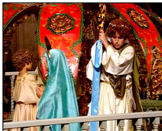
Representación del Misteri

El Palmeral de Elche, junto con la representación sacra del Misterio de Elche, han sido declarados por la Unesco Patrimonio de la Humanidad y Obra Maestra del Patrimonio Oral e Intangible de la Humanidad respectivamente. Estos símbolos de identidad ilicitanos son unos de los principales atractivos turísticos de esta ciudad de tradición industrial.