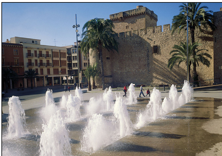
Castillo de Altamira

El sector económico por excelencia es el industrial y gira en torno al calzado y sus productos intermedios. En Elche se fabrica alrededor de un 42% del calzado producido en España y es uno de los principales productores de Europa. La exportación de calzado ilicitano contribuye notablemente a que la provincia de Alicante presente uno de los mejores saldos exportadores del país. Una gran parte de las empresas del sector se concentran en el área de Elche Parque Industrial, con una superficie de más de 1.200.000 m 2 . El resto del sector industrial es diverso, habiendo empresas de las industrias del metal, de la química y de la construcción, entre otras.