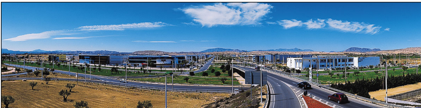
Parque industrial de Elche

Elche cuenta en su término municipal con el Aeropuerto de Alicante, entre las pedanías de Torrellano y El Altet. Se accede a él a través de la N-338 bien desde la A-7 o desde la N-332. Ocupa el sexto lugar en la red aeroportuaria española por número de pasajeros con 9.120.819 en 2007, tras los aeropuertos de Madrid-Barajas, Barcelona, Palma de Mallorca, Málaga y Gran Canaria y se sitúa entre los 50 de mayor tránsito de Europa. Actualmente se encuentra en fase de construcción la nueva terminal del aeropuerto.