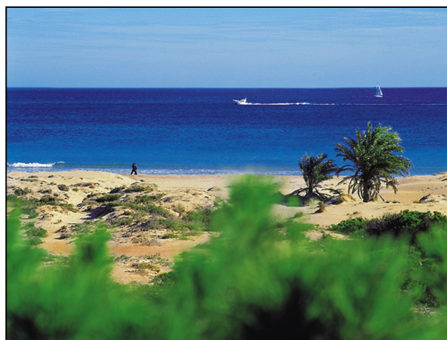
Dunas del Carabassi