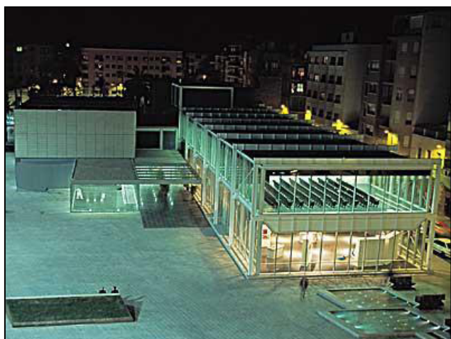
Palacio de Congresos