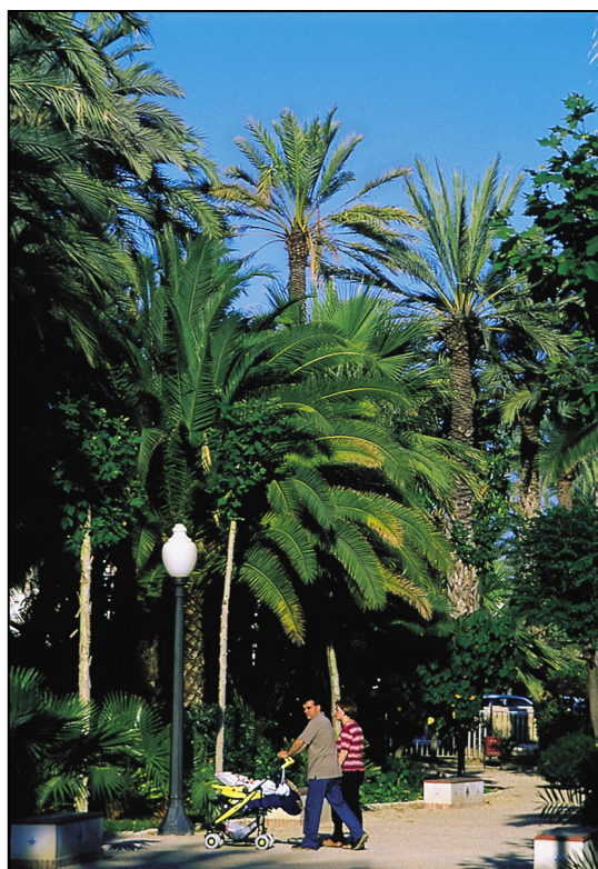
Palmeral de Elche

Elche está situada en la provincia de Alicante, a orillas del río Vinalopó. Cabecera de la comarca del Bajo Vinalopó, su población supera los 228.300 habitantes, siendo la segunda ciudad más poblada de la provincia de Alicante, la tercera de la Comunidad Valenciana y la vigésima en población a nivel nacional.