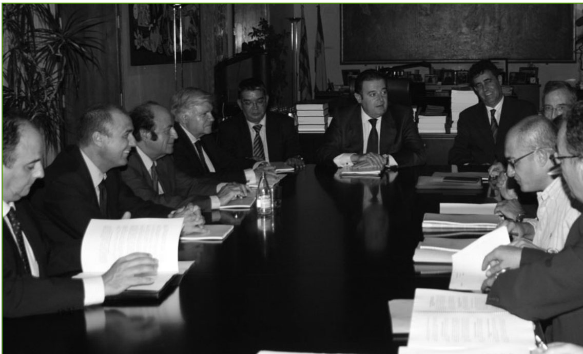
La reunión para la firma del PAVACE dejó, una vez más, a los trabajadores independientes de lado

Nunca como hasta hoy la libertad sindical ha estado más amenazada y nunca, como hoy, las relaciones laborales han sido “una merienda de negros”, dicho sea con el debido respeto y sin ánimo racista.